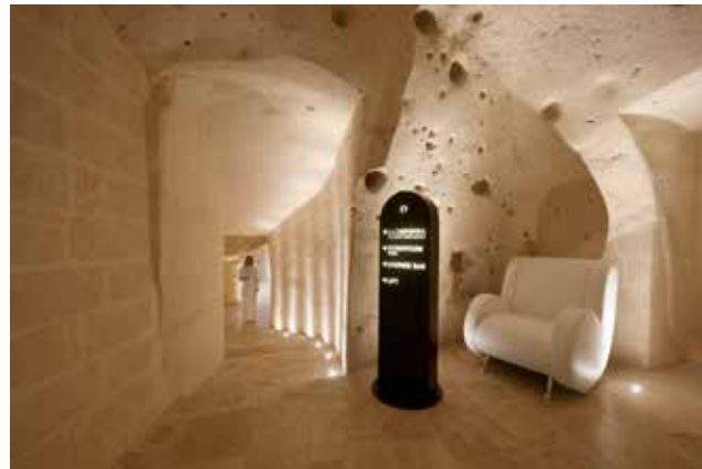
Описание предоставлено авторами проекта. Description provided by the authors of the project.